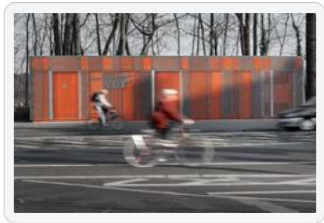
Gleichrichterwerk in Frankfurt mit feuerverzinkter Gitterrostfassade

Gleichrichterwerk Rennbahnstraße Rennbahnstraße 60528 Frankfurt am Main (Niederrad)