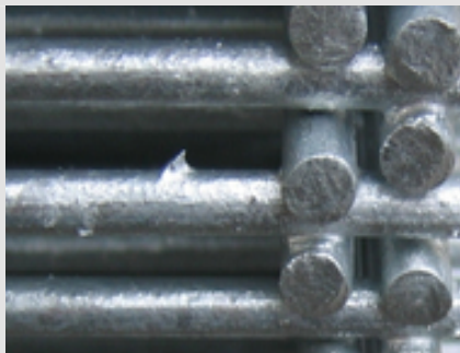
➔ Abb. 3: Ungänzen im Stahlwerkstoff werden nach dem Feuerverzinken deutlicher sichtbar.

Diese Oberflächenerscheinungen im Stahl sind vor dem Verzinken mit dem bloßen Auge kaum wahrzunehmen. Durch den Verzinkungsvorgang werden Ungänzen jedoch deutlich sichtbar. Auf der feuerverzinkten Oberfläche erscheinen derartige Stellen dann als Streifen, Unebenheiten, Pickel, und Grate (Abb. 3, 4, 5). Bei der Stahlbestellung können die Anforderungen an die Oberflächenbeschaffenheit nach der Normenreihe DIN EN 10163 Teile1-3 definiert werden.