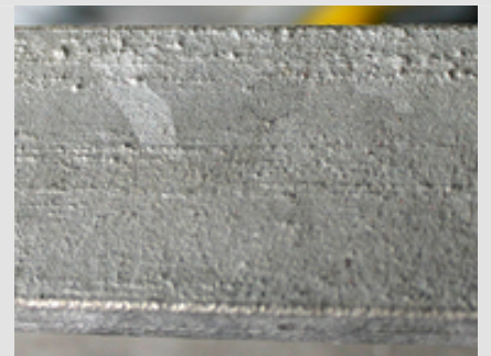
➔ Abb. 5: Unebene Zinkoberfläche durch Ungänzen im Stahlwerkstoff.