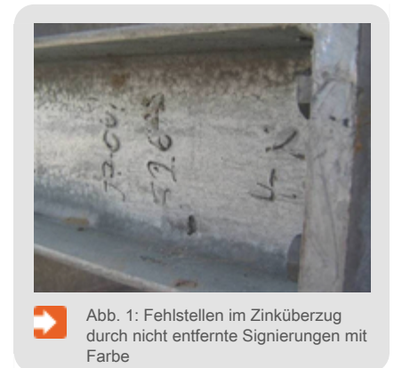
Abb. 1: Fehlstellen im Zinküberzug durch nicht entfernte Signierungen mit Farbe

Eine metallisch blanke Stahloberfläche ist die Grundvoraussetzung für das Feuerverzinken. Verunreinigungen auf der Stahloberfläche verschlechtern das Benetzungsverhalten der Zinkschmelze und können die Legierungsbildung behindern. Der für die Verzinkung erforderliche Oberflächenvorbereitungsgrad Be nach DIN EN ISO 12944-4 wird in der Verzinkerei durch Entfetten und Beizen hergestellt. Jede Stahloberfläche ist jedoch aufgrund ihrer chemischen Beschaffenheit, ihrer Herstellung, ihrer Bearbeitung oder ihrer vorausgegangenen Beanspruchung mit artfremden oder arteigenen Schichten bedeckt.