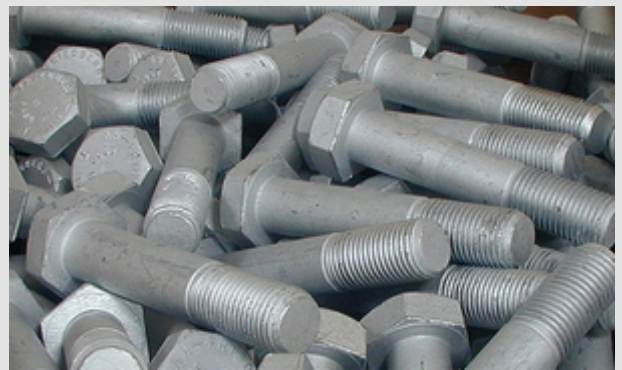
Abb. 1: Feuerverzinkte HV-Schrauben der Festigkeitsklasse 10.9

Die Begriffe hochfester und höherfester Stahlwerkstoff sind nicht klar definiert. Im Allgemeinen werden damit Stähle mit einer Mindeststreckgrenze > 500 \text{ N/mm}^2 beschrieben. Im Arbeitsblatt B.2 sind die Grundlagen und Anforderungen an den Werkstoff Stahl beschrieben. Normale Baustähle nach DIN EN 10025 Teile 1-4 bis zu einer Streckgrenze von 500 \text{ N/mm}^2 sind für das Feuerverzinken in der Regel unproblematisch. Sollen Stähle außerhalb dieser Normenreihe feuerverzinkt werden, sind unter Umständen besondere Abstimmungen mit der Feuerverzinkerei erforderlich. Das gilt besonders für höherfeste und vergütete Werkstoffe. Grundsätzlich lassen sich auch höherfeste Werkstoffe im kontrollierten Prozess gut feuerverzinken. Im großen Maße werden zum Beispiel Schrauben der Festigkeitsklasse 10.9 feuerverzinkt und zur Anwendung gebracht (Abb.1).