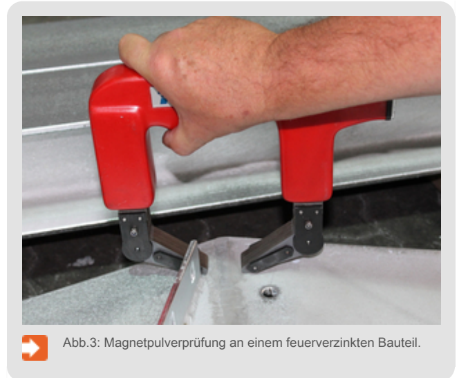
Abb.3: Magnetpulverprüfung an einem feuerverzinkten Bauteil.

Die Fertigung solcher höherfesten Bauteile stellen ganz besondere Anforderungen an den metallverarbeitenden Betrieb und an den zuständigen Schweißer. Für beide sind besondere und spezielle Qualifikationen bzw. Prüfungen notwendig. Höherfeste Stähle müssen für das Schweißen mitunter kontrolliert vorgewärmt und wieder abgekühlt werden. Solche Schweißnähte werden zudem nach der Fertigung vielfach geprüft. Werden höherfeste Werkstoffe feuerverzinkt, empfiehlt es sich nach dem Feuerverzinken, das Bauteil bzw. die kritischen Bereiche seitens des Herstellers auf mögliche Rissbildung zu untersuchen (Abb.3). Bei Serienartikeln (z.B. im Fahrzeugbau) empfiehlt es sich, eine werkseigene Produktionskontrolle aufzubauen, um die Eigenschaften der Konstruktion und des Werkstoffes sicherzustellen. Vergütete Bauteile können unter Umständen durch die Wärmeeinwirkung beim Feuerverzinken auch einen Teil der Festigkeit verlieren.