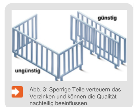
➔ Abb. 3: Sperrige Teile verteuern das Verzinken und können die Qualität nachteilig beeinflussen.

Zweidimensionale Konstruktionen lassen sich wirtschaftlicher verzinken als dreidimensionale Konstruktionen (Abb. 3). Große, abgewinkelte (dreidimensionale) Konstruktionen erhöhen die Verzinkungskosten, da Traversen während des Feuerverzinkens nicht optimal genutzt werden können. Die Verzinkungsqualität kann zudem nachteilig beeinflusst werden. Konstruktionen sollten daher möglichst zweidimensional geplant werden.