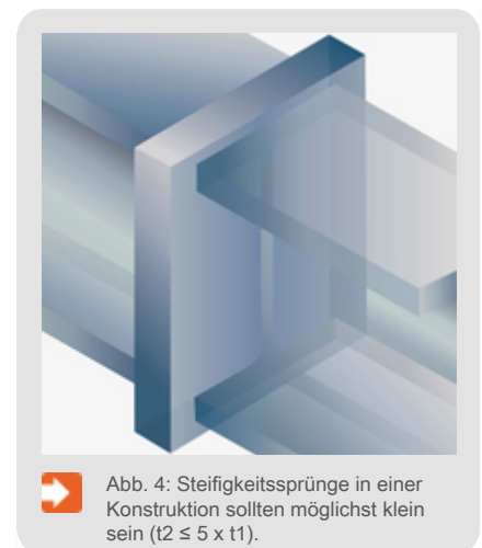
➔ Abb. 4: Steifigkeitssprünge in einer Konstruktion sollten möglichst klein sein ( t_2 \leq 5 \times t_1 ).

Stahlbauteile müssen sich zur Bildung der Eisen-Zink-Legierung komplett auf die Zinkbadtemperatur erwärmen. Das Detail mit der größten Materialdicke bestimmt dabei die Tauchdauer. Dünnwandige Bauteile erreichen deutlich schneller die Zinkbadtemperatur als dickwandige Bauteile. Die Materialausdehnung und das Abkühlverhalten zwischen dick- und dünnwandigen Bauteilen kann je nach Dickenverhältnis unterschiedlich ablaufen. Optimal sind Werkstücke mit gleichen oder nahezu gleichen Materialdicken. Da dies eher die Ausnahme ist, ist darauf zu achten, dass das Verhältnis von minimaler Materialdicke zu maximaler Materialdicke den Verhältniswert 1:5 nicht überschreitet (Abb. 4). Bei sehr ungünstigen Dickenverhältnissen sollte über eine lösbare Verbindung (z. B. Schraubverbindung) der einzelnen Elemente nachgedacht werden.