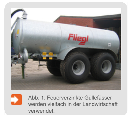
Abb. 1: Feuerverzinkte Güllefässer werden vielfach in der Landwirtschaft verwendet.

Im Gegensatz zu anderen Verfahren werden beim Feuerverzinken Hohlprofile, Behälter und Rohrkonstruktionen außen und innen vor Korrosion geschützt. Feuerverzinkte Behälter haben sich seit Jahrzehnten in vielen Anwendungsbereichen wie beispielsweise der Landwirtschaft (Abb. 1) bewährt. Für den verfahrensbedingten Tauchprozess während der Vorbehandlung und in der Zinkschmelze müssen Bauteile mit hinreichend groß dimensionierten Zu-, Ablauf- und Entlüftungsöffnungen versehen werden. Behälter müssen so gestaltet werden, dass die gesamte Luft der Hohlkonstruktion beim Verzinkungsvorgang entweichen kann. Nur so kann das Bauteil vollständig in die Zinkschmelze eingetaucht werden. Zink muss an jede Stelle der Konstruktion gelangen können und in Hohlräume vollständig hinein- und herauslaufen können. Geschlossene Behälter und große Überlappungsflächen müssen entweder vermieden oder mit Entlüftungsöffnungen versehen werden, anderenfalls können gefährliche Explosionen beim Verzinken entstehen (s. Arbeitsblatt C.3).