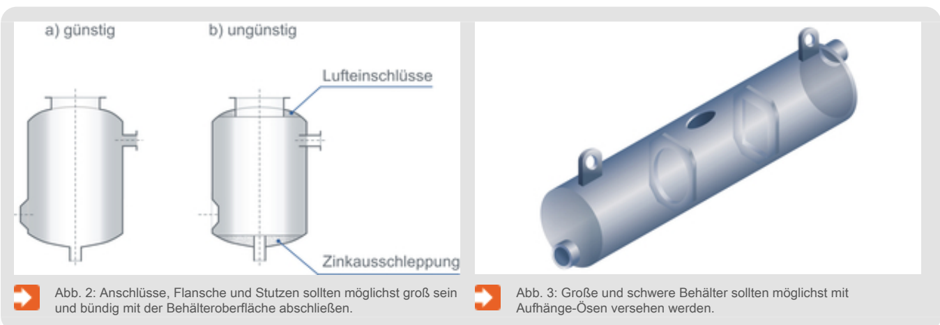
Abb. 2: Anschlüsse, Flansche und Stutzen sollten möglichst groß sein und bündig mit der Behälteroberfläche abschließen.

Bei Behälterkonstruktionen ist darauf zu achten, dass Anschlüsse, Flansche und Stutzen so groß wie möglich ausgebildet sind und stets so angebracht werden, dass sie möglichst bündig mit der Oberfläche des Behälters abschließen (Abb. 2). Hierdurch wird sichergestellt, dass das in der Regel große Luftvolumen beim Eintauchen in die Zinkschmelze entweichen kann und der Behälter nicht aufschwimmt. Zudem werden hierdurch das Ausschleppen von Zink und Fehlstellen durch Lufteinschlüsse vermieden. Lufteinschlüsse entstehen unter anderem durch eingezogene Rohrstutzen oder durch Entlüftungsöffnungen, die nicht an der obersten Stelle des Behälters angebracht sind.