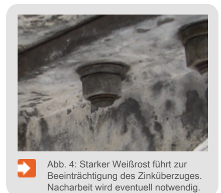
Abb. 4: Starker Weißrost führt zur Beeinträchtigung des Zinküberzuges. Nacharbeit wird eventuell notwendig.