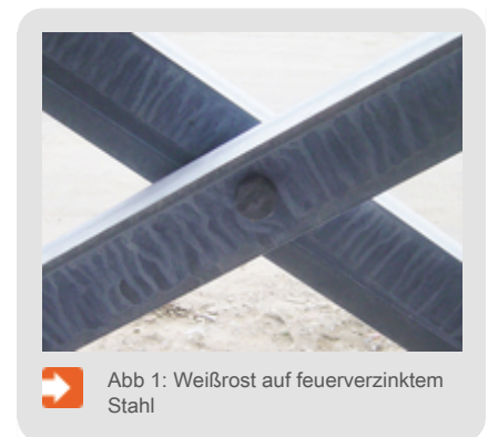
Abb 1: Weißrost auf feuerverzinktem Stahl

Der dauerhafte Korrosionsschutz der Feuerverzinkung basiert auf der Bildung schützender Deckschichten, die durch natürliche Witterungseinflüsse im Laufe einiger Wochen bis Monate auf der Oberfläche feuerverzinkter Stahlteile entstehen. Diese Deckschichten bestehen überwiegend aus basischem Zinkcarbonat ( Zn_5(OH)_6(CO_3)_2 ). Die schützenden Deckschichten können sich jedoch nicht ausbilden, wenn die Zinkoberfläche über einen längeren Zeitraum dauerhaft mit Wasser benetzt wird oder wenn der Luftzutritt unzureichend ist. In solchen Fällen bildet sich auf der Oberfläche verzinkter Bauteile sogenannter "Weißrost" (Abb. 1). Weißrost besteht überwiegend aus Zinkhydroxid, einem geringen Anteil Zinkoxid und nur wenig Zinkcarbonat. Weißrost hat keine genau definierte Zusammensetzung, da diese von den jeweiligen Entstehungsbedingungen abhängig ist.