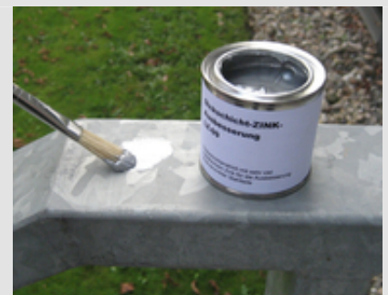
➔ Abb. 2: Die Ausbesserung mit Zinkstaubbeschichtungen mittels Pinsel ist praxisbewährt und zu empfehlen.