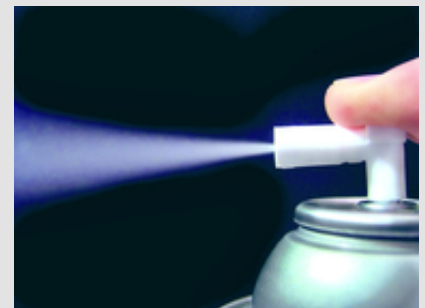
➔ Abb. 4: Zinksprays sind zur Ausbesserung von Fehlstellen in der Regel ungeeignet.