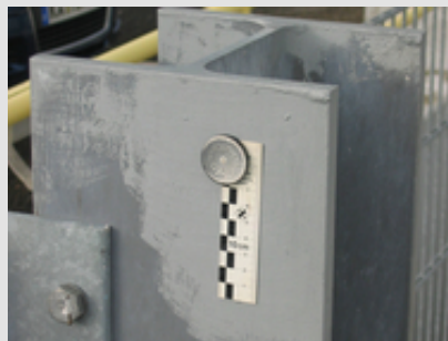
➔ Abb. 3: Falsch: Kleine Fehlstellen werden oft sehr großflächig ausgebessert.

Um einen lückenlosen Schutz sicherzustellen, ist die Ausbesserung so durchzuführen, dass eine Überlappung mit dem intakten Zinküberzug sichergestellt ist. In der Praxis werden allerdings selbst kleine Fehlstellen oft sehr großflächig ausgebessert (Abb 3). Dadurch wird der Eindruck einer großen Fehlstelle im Zinküberzug vermittelt. Es wird empfohlen, nur mit kleinen Überlappungsflächen zu arbeiten, um den ausgebesserten Bereich möglichst klein zu halten.