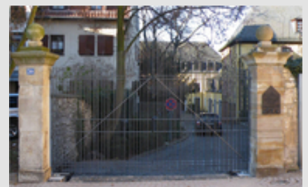
➔ Abb. 3: Eine Feuerverzinkung schützt dauerhaft vor Korrosion, hier zusätzlich beschichtet als "Duplex-System".