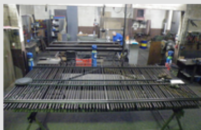
➔ Abb. 2: Feuerverzinkungsgerechtes Konstruieren und Fertigen schafft ein gutes Verzinkungsergebnis.