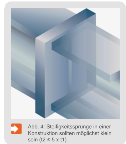
Abb. 4: Steifigkeitssprünge in einer Konstruktion sollten möglichst klein sein ( t_2 \leq 5 \times t_1 ).

Stahlbauteile müssen sich zur Bildung der Eisen-Zink-Legierung komplett auf die Zinkbadtemperatur erwärmen. Das Detail mit der größten Materialdicke bestimmt dabei die Tauchdauer. Dünnwandige Bauteile erreichen deutlich schneller die Zinkbadtemperatur als dickwandige Bauteile. Die Materialausdehnung und das Abkühlverhalten zwischen dick- und dünnwandigen Bauteilen kann je nach Dickenverhältnis unterschiedlich ablaufen. Optimal sind Werkstücke mit gleichen oder nahezu gleichen Materialdicken. Da dies eher die Ausnahme ist, ist darauf zu achten, dass das Verhältnis von minimaler Materialdicke zu maximaler Materialdicke den Verhältniswert 1:5 nicht überschreitet (Abb. 4). Bei sehr ungünstigen Dickenverhältnissen sollte über eine lösbare Verbindung (z. B. Schraubverbindung) der einzelnen Elemente nachgedacht werden.