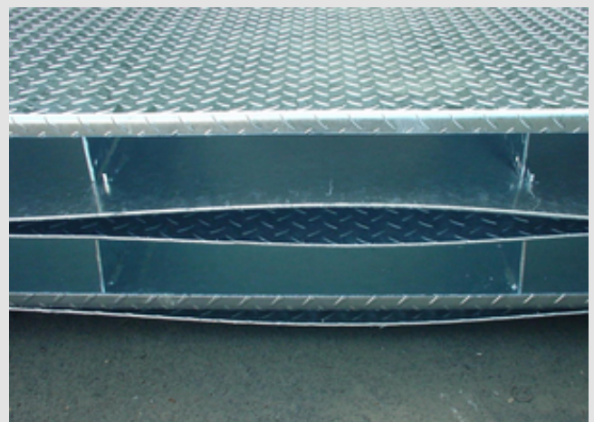
Abb. 2: Verzug an einem Bauteil durch Eigenspannungen

Verantwortlich für einen unter Umständen auftretenden Verzug beim Feuerverzinken ist der Abbau von Spannungen als Folge der Erwärmung der Stahlteile im ca. 450 °C heißen Zinkbad (Abb. 1). Bei dieser Temperatur verringert sich die Streckgrenze des Stahls gegenüber den Werten bei Raumtemperatur auf etwa 70 %. Bei sehr hohen Eigenspannungen in einer Stahlkonstruktion kann es dann unter Umständen dazu kommen, dass vorhandene Spannungsspitzen sich durch plastische Formänderung abbauen (Abb. 2).