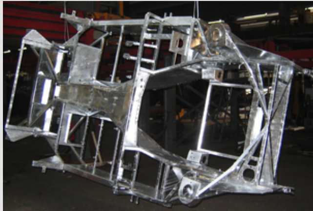
➔ Abb. 3: Stückverzinktes Stahlblechchassis eines Wiesmann MF3.