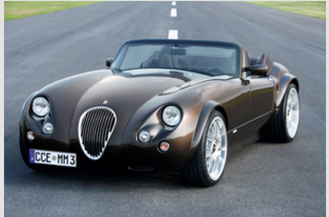
➔ Abb. 4: Der Wiesmann MF3 verfügt über ein stückverzinktes Chassis.

Um Materialverzug zu vermeiden, muss die Summe aller Spannungen minimiert und begrenzt werden. Dazu sind mehrere Maßnahmen möglich, die im Folgenden aufgeführt sind: