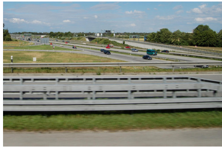
Abb. 5: Von der Schutzplanke bis zum LKW-Trailer - in der Verkehrstechnik wird bevorzugt feuerverzinkt