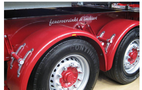
Abb. 9: Duplex-Systeme werden in allen Einsatzbereichen verwendet, beispielsweise im Fahrzeugbau.