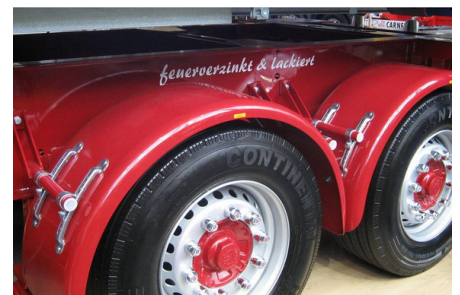
Abb. 9: Duplex-Systeme werden in allen Einsatzbereichen verwendet, beispielsweise im Fahrzeugbau.