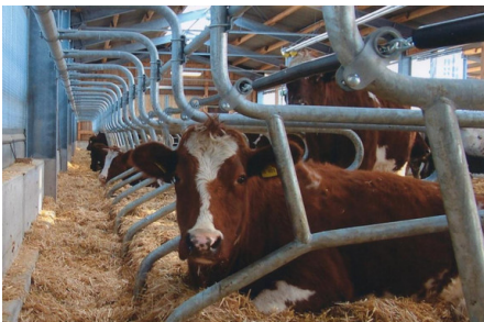
Abb. 7: In der Landwirtschaft kommt feuerverzinkter Stahl im Stall- und Landmaschinenbau zum Einsatz.

Auch im Maschinenbau, wo hochfeste Stahlwerkstoffe zum Einsatz kommen, hat sich das Feuerverzinken als Korrosionsschutz etabliert. Hauptanwendungen sind stark beanspruchte Konstruktionen, wie Ski-Lifte, Baukräne, aber auch Kleinbauteile wie feuerverzinkte HV-Schrauben der Klasse 10.9 gehören zum Standardsortiment.