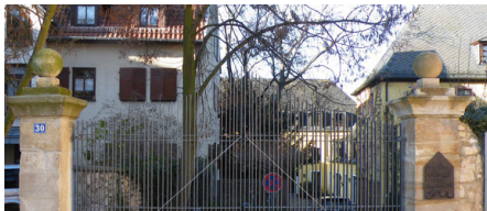
Abb. 1: Metallbau-Konstruktion werden zumeist feuerverzinkt.

Die Feuerverzinkung ist die erste Wahl bei Korrosionsschutzlösungen für den Werkstoff Stahl. Neben der extrem langen Schutzdauer, die häufig mit der Nutzungsdauer übereinstimmt, überzeugt hier die Wartungsfreiheit dieses Systems. Korrosionsschutzdauern von 50 Jahren und mehr sind keine Seltenheit, wie zahlreiche Referenzen belegen. Hinzu kommt eine hohe mechanische Beständigkeit des Zinküberzuges. Neben diesen technischen Vorzügen wird feuerverzinkter Stahl seit vielen Jahren als gestalterisches Element von Planern und Architekten bevorzugt eingesetzt, da hierbei die metallische Authentizität des Stahls erhalten bleibt. Die bedeutendsten Einsatzbereiche der Feuerverzinkung sind im Folgenden aufgeführt: