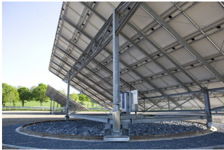
Abb. 4: Die Feuerverzinkung ist dabei - ob Strommaste oder Energieerzeugung