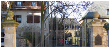
Abb. 1: Metallbau-Konstruktion werden zumeist feuerverzinkt.

pDie Feuerverzinkung ist die erste Wahl bei Korrosionsschutzlösungen für den Werkstoff Stahl. Neben der extrem langen Schutzdauer, die häufig mit der Nutzungsdauer übereinstimmt, überzeugt hier die Wartungsfreiheit dieses Systems. Korrosionsschutzdauern von 50 Jahren und mehr sind keine Seltenheit, wie zahlreiche Referenzen belegen. Hinzu kommt eine hohe mechanische Beständigkeit des Zinküberzuges. Neben diesen technischen Vorzügen wird feuerverzinkter Stahl seit vielen Jahren als gestalterisches Element von Planern und Architekten bevorzugt eingesetzt, da hierbei die metallische Authentizität des Stahls erhalten bleibt. Die bedeutendsten Einsatzbereiche der Feuerverzinkung sind im Folgenden aufgeführt:/p