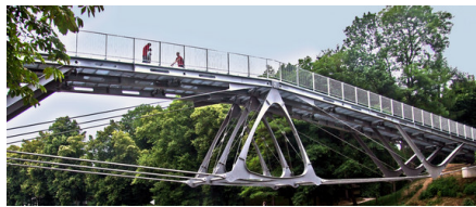
Abb. 2: Der Stahlbau gehört zu den Domänen des Feuerverzinkens.