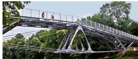
Abb. 2: Der Stahlbau gehört zu den Domänen des Feuerverzinkens.