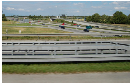
Abb. 5: Von der Schutzplanke bis zum LKW-Trailer - in der Verkehrstechnik wird bevorzugt feuerverzinkt