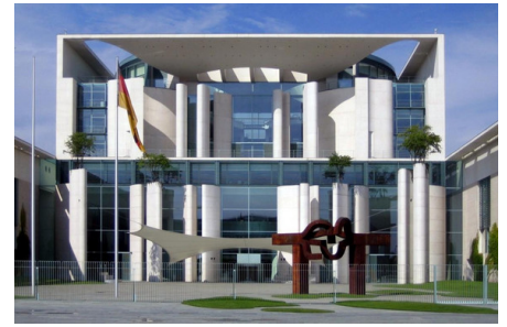
Abb. 6. Bundeskanzleramt: Feuerverzinkter Betonstahl wird oft für Weissbeton-Fassaden verwendet.