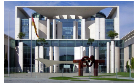
Abb. 6. Bundeskanzleramt: Feuerverzinkter Betonstahl wird oft für Weissbeton-Fassaden verwendet.