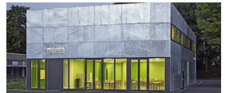
Abb. 3: Ein Werkstoff für die Fassade: Bekleidung, Unterkonstruktion und Verbindungsmittel werden feuerverzinkt.