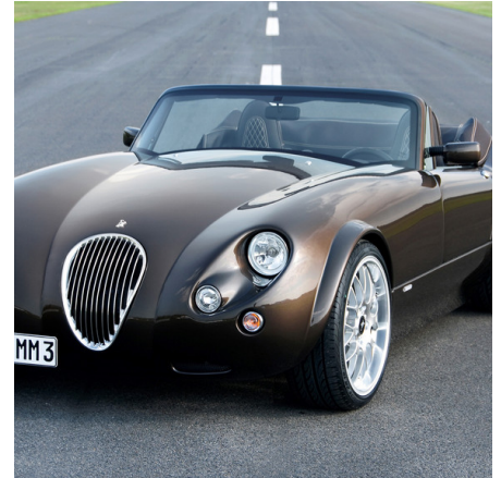
Abb. 4: Der Wiesmann MF3 verfügt über ein stückverzinktes Chassis.

Dass bei sorgfältiger Vorplanung selbst das Feuerverzinken von komplizierten, dünnwandigen Blechkonstruktionen ohne nennenswerten Verzug möglich ist, zeigt sich in der Automobiltechnik, in der in einigen Fällen stückverzinkte Blechkonstruktionen als Chassis eingesetzt werden (siehe Abb. 3 und 4).